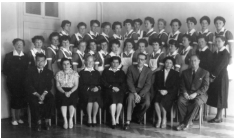
Študentke z gospo Merljakovo – predavateljci. Vpis 1953, diploma 1956. leta

Žig Višje šole lahko zasledimo na vpisnici v letu 1953. Prakse so bile kandidatke prvih dveh generacij